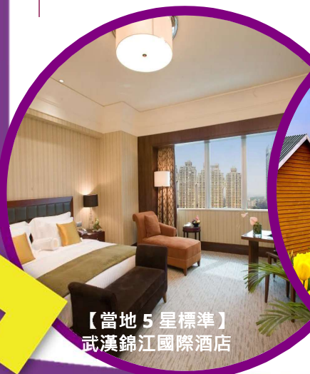
【當地 5 星標準】 武漢錦江國際酒店

一座利用原有村灣、花田、河流、湖泊等資源組合建設的法式文旅小鎮，集花海觀賞、法式風情、美食體驗、田園度假於一體，四季花開不敗，特色活動豐富，適合各年齡層遊客享受自然與文化的慢生活體驗。